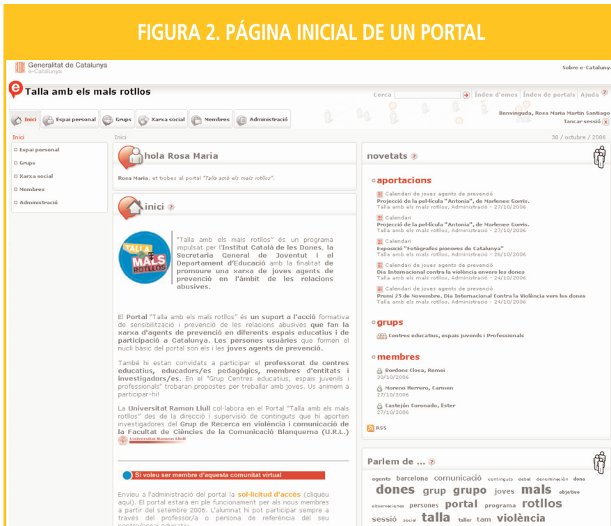
FIGURA 2. PÁGINA INICIAL DE UN PORTAL

Dentro de un portal se pueden crear grupos, que reúnen diversos usuarios con el objetivo de trabajar juntos