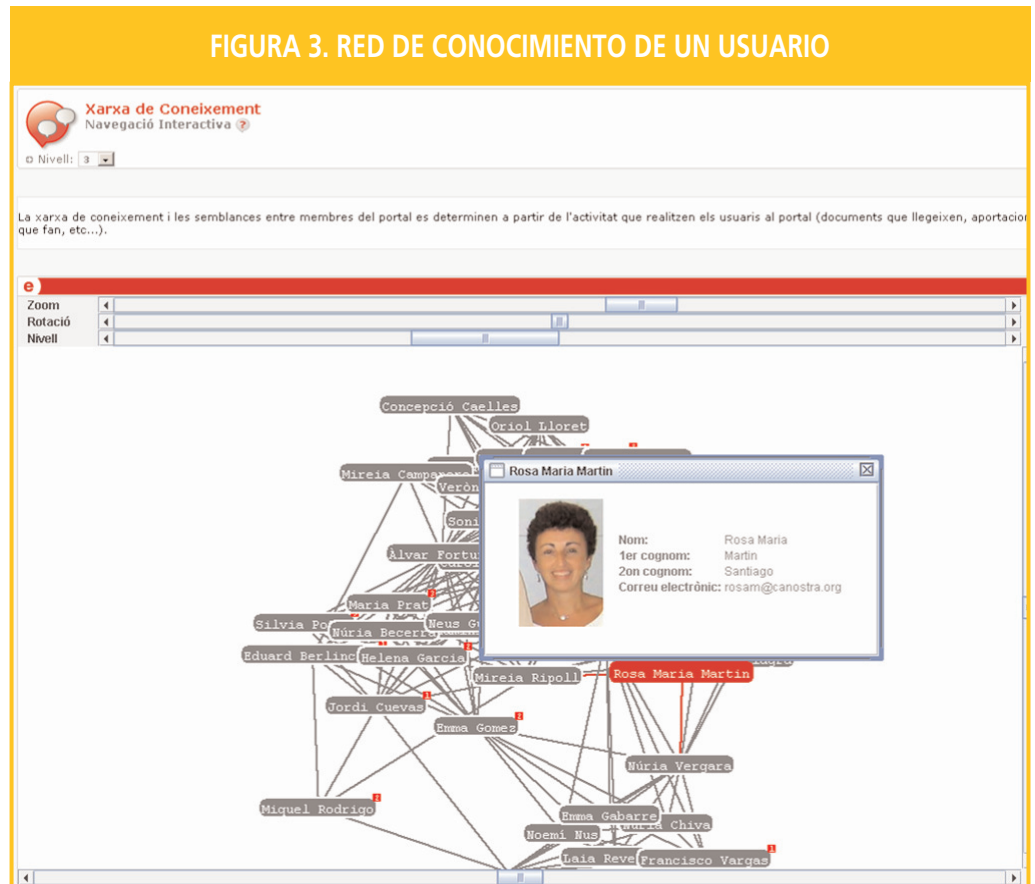
FIGURA 3. RED DE CONOCIMIENTO DE UN USUARIO

En el caso de la red de conocimiento, ésta se construye a partir de la actividad desarrollada por los usuarios de un portal. Así, el análisis de la actividad desarrollada por los miembros de un portal permite crear relaciones implícitas con otros miembros del mismo y determinar la red de conocimiento de cada persona. A partir de esta red, se pueden realizar las siguientes acciones: